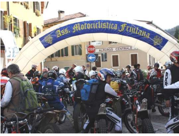
Il via della 2 a Moto Cavalcata del Monte Bernardia