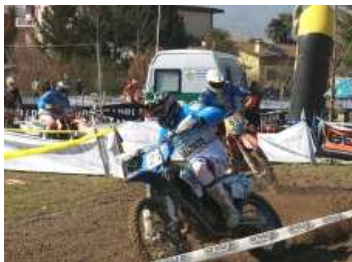
20anni di Enduro Country a Sacile con il Mc Albatros