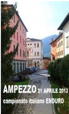
Campionato Italiano Assoluto Enduro 2013